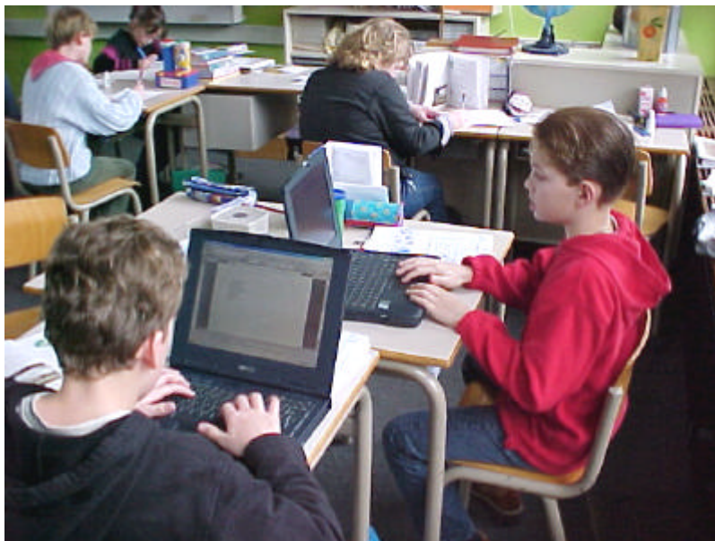
Foto 4 Laptop gebruik

De laptops zijn vanwege de flexibiliteit en beperkte ruimte per leerling voor desktops veel in gebruik. De school zou nu graag over 30 laptops voor leerlingen willen beschikken. Schade aan laptops is nog nauwelijks opgetreden, ondanks intensief gebruik.