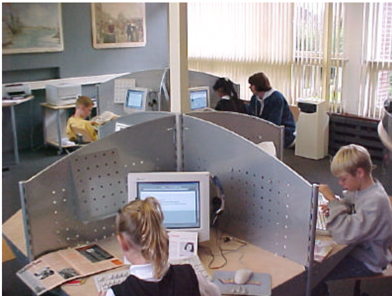
Foto 6 De mediatheek

De computers in de mediatheek worden voor veel doeleinden gebruikt: remediërend onderwijs, individuele taken door leerlingen, projecten van leerlingen, overloop voor extra computers van de eraanstaande groepen.