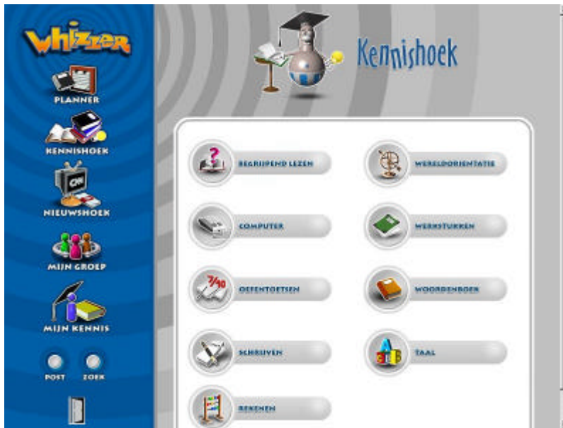
Foto 5 Whizzer, de kennishoek

De school vindt een elektronische leeromgeving als Whizzer nog steeds een zeer belangrijk middel voor de organisatie van het onderwijsleerproces. Door onvoldoende passende content is echter op dit moment het gebruik zeer beperkt. Het project van de taakplanner voor de leerlingen is gestopt.