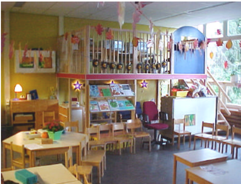
Foto 7 Kleuterlokaal met vide met computers