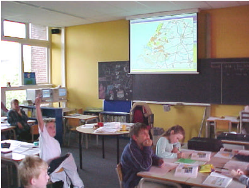
Foto 3 Beamer in ieder lokaal