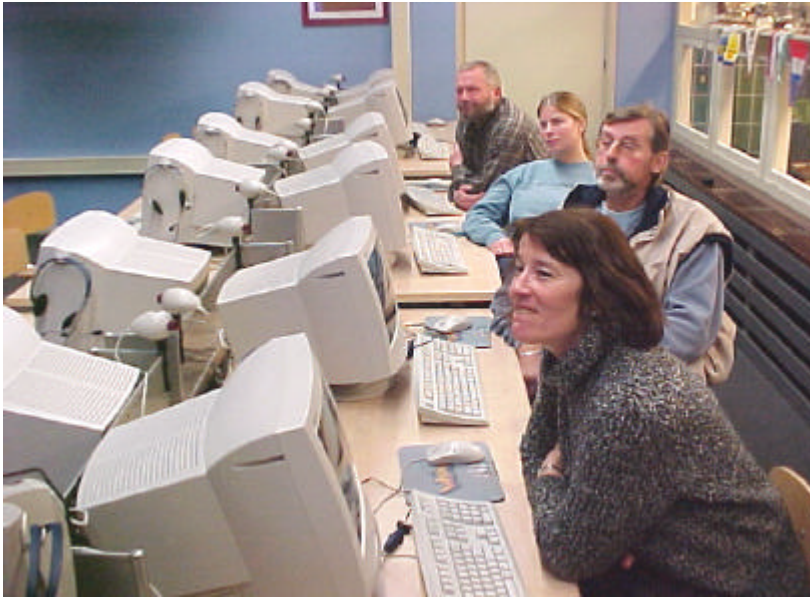
Foto 1 Docenten in het computerlokaal

De docenten ontwikkelen zich in een verschillend tempo. Naarmate men in hogere leerjaren komt zijn de docenten afhankelijker van methodegebonden software.