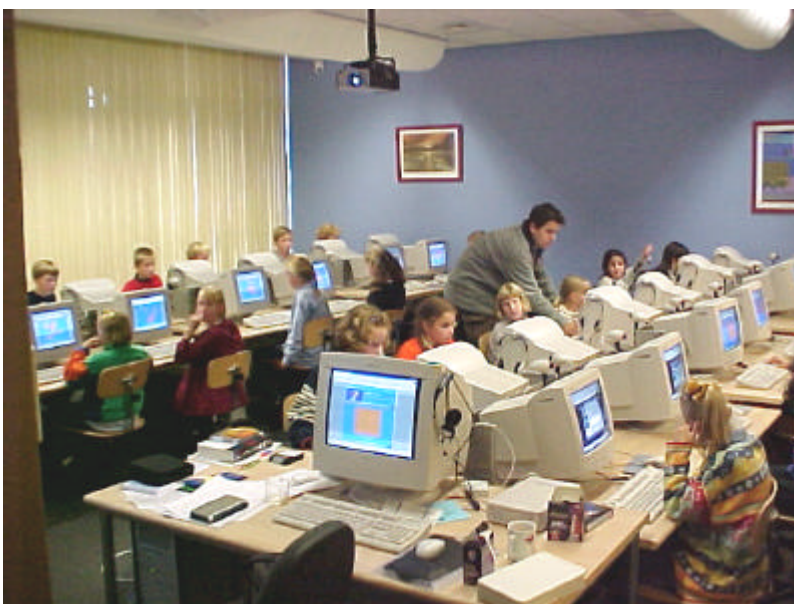
Foto 2 Leerlingen in het computerlokaal